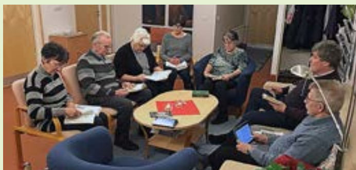
Bibelsitskonceptet påminner om Alpha-kurserna.

Deltagarna upplever bibelsitsen som väldigt